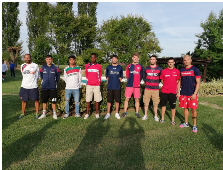
Un gruppo di giocatori indossano tutte le maglie e le divise della prossima stagione