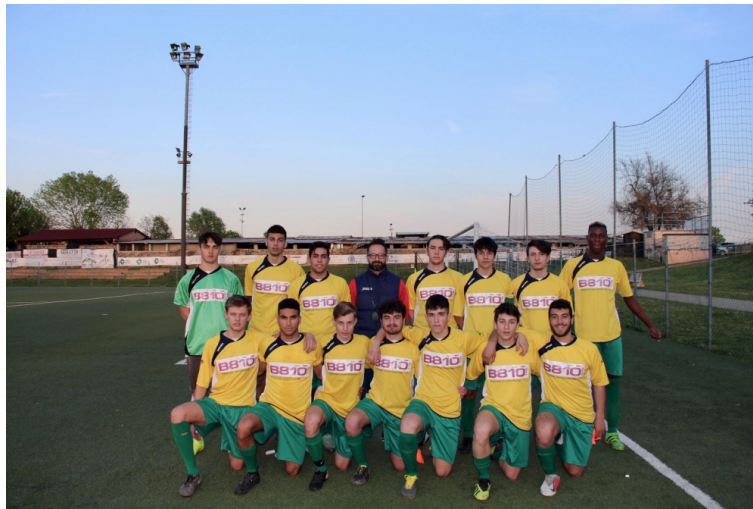
Foto di gruppo prima del derby poi stravinto contro la FalkGalileo