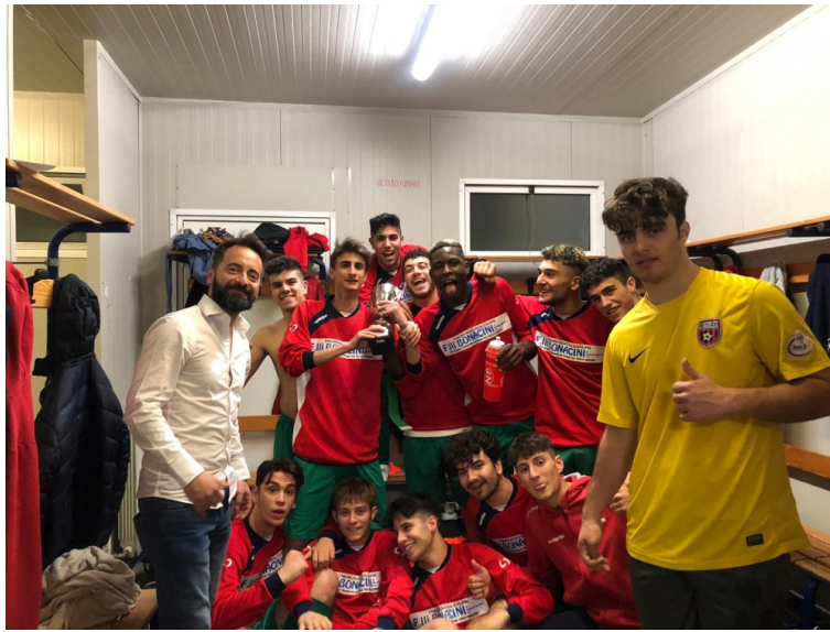
Dopo le premiazioni esplode negli spogliatoi la meritata gioia della Bagnolese Juniores