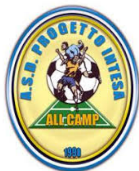
Logo Progetto Intesa

Dopo una sola ma storica stagione di sinergia, la Bagnolese non allestirà più la Juniores Regionale in collaborazione con la Virtus Bagnolo. I rossoblù hanno preso atto della decisione della stessa Virtus Bagnolo, che intende comporre nuovamente una propria Juniores Provinciale. Non avendo un settore giovanile alle spalle, la Bagnolese ha già individuato un nuovo partner. I rossoblù hanno siglato un accordo con il Progetto Intesa, società con sede a Gualtieri ma creata nel 1998 come importante e vincente "contenitore" dell'intera attività giovanile della bassa reggiana. La Bagnolese "lega" il proprio nome ad una realtà da sempre ai vertici del movimento, sia per organizzazione che per risultati. La Juniores Regionale dei rossoblù della prossima annata tornerà quindi a giocare fuori paese, come nelle passate esperienze con Reggio Calcio (una stagione ai tempi degli Juniores Nazionali in Serie D), Santos (un biennio) e Tricolore Reggiana (il triennio che ha preceduto lo storico accordo con la Virtus Bagnolo). In tal senso la nuova location della Bagnolese sarà Cadelbosco Sopra, con il Progetto Intesa che ne spalmerà l'attività su due impianti. La Juniores Regionale dei rossoblù svolgerà gli allenamenti settimanali sul campo B del Comunale Nuovo, mentre le partite ufficiali si disputeranno al Dallari. (Luca Cavazzoni)