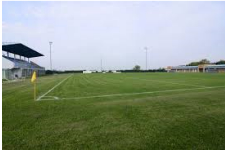
Il Comunale Nuovo di Cadelbosco Sopra dove la Bagnolese disputerà la Coppa Italia

La Bagnolese ha deciso, giocherà la Coppa Italia a Cadelbosco Sopra. Per difendere la coccarda regionale vinta la scorsa annata per la terza volta nella loro storia, i rossoblù hanno scelto il Comunale Nuovo. La motivazione è per tenere sempre più vivi anche i rapporti con il Progetto Intesa, con il quale è stata allestita la Juniores Regionale. Il club con sede a Gualtieri che gestisce l'impianto aveva chiesto di valutare questa possibilità ai ragazzi di Claudio Gallicchio, che nella passata stagione avevano clamorosamente sfiorato la Serie D arrivando fino alle storiche semifinali nazionali.(Luca Cavazzoni)