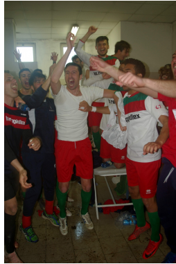
Tripudio Bagnolese negli spogliatoi del Fratelli Campari