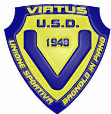
Logo Virtus Bagnolo

Da giovedì 4 Aprile a sabato 27 Aprile la Bagnolese Juniores parteciperà come di consueto al torneo Val Secchia, giunto alla sua terza edizione ed organizzato dalla SanMichelese in collaborazione con la Casalgrandese.