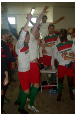
E' apoteosi Bagnolese negli spogliatoi del Fratelli Campari

Come previsto, l'avversario della Bagnolese nelle semifinali della fase nazionale della Coppa Italia sarà il Caldiero Terme. E sempre come previsto, le due partite dei rossoblù saranno in agenda per mercoledì 3 Aprile e per mercoledì 10 Aprile sempre alle ore 15. I ragazzi di Claudio Gallicchio giocheranno l'andata al Berti di Caldiero in provincia di Verona, mentre il ritorno sarà casalingo al Fratelli Campari.(Luca Cavazzoni)