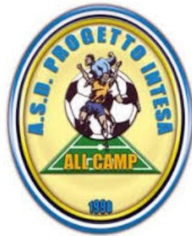
Logo Progetto Intesa