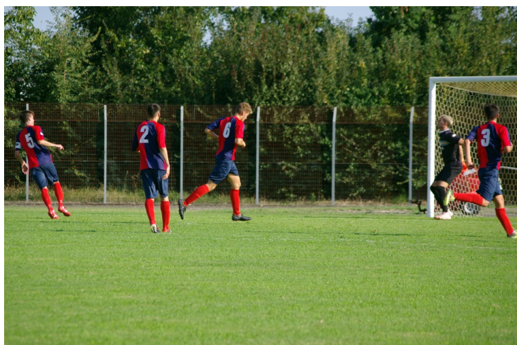
Un'immagine dell'amichevole giocata ieri al Morelli

Nella sezione dedicata alla foto gallery, potete trovare le immagini dell'amichevole Brescello-Bagnolese. Le foto sono state scattate e poi gentilmente concesse da Ezio Siligardi, carissimo e preziosissimo amico.(Luca Cavazzoni)