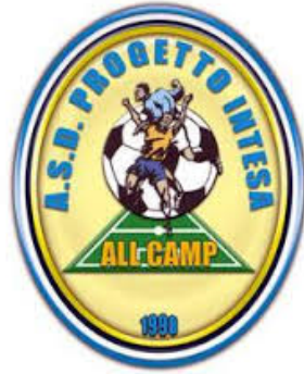
Logo Progetto Intesa

Contrariamente a quanto già da tempo era stato ufficializzato, la Bagnolese Juniores non disputerà le proprie gare interne di campionato al Dallari di Cadelbosco Sopra. Novità di questi giorni è infatti il cambio di campo, con i baby rossoblù che giocheranno quindi al Comunale Nuovo sempre a Cadelbosco Sopra. I ragazzi di Emiliano Genitoni si spostano quindi verso l'impianto più nuovo e di dimensioni maggiori, prevalentemente per ragioni dovute all'illuminazione. La variazione per la compagine targata Progetto Intesa è già stata ratificata anche dal Crer, che ne ha dato evidenza nel suo classico bollettino settimanale diramato nel tardo pomeriggio di ieri. (Luca Cavazzoni)