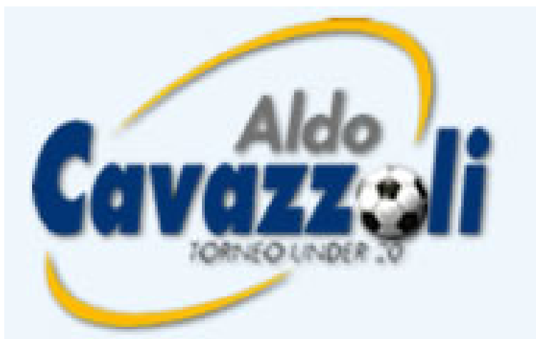
Logo torneo Cavazzoli Under 20

Martedì 7 Maggio: Montecchio-Atletico Montagna al Comunale di Sant'Ilario d'Enza (ore 21)