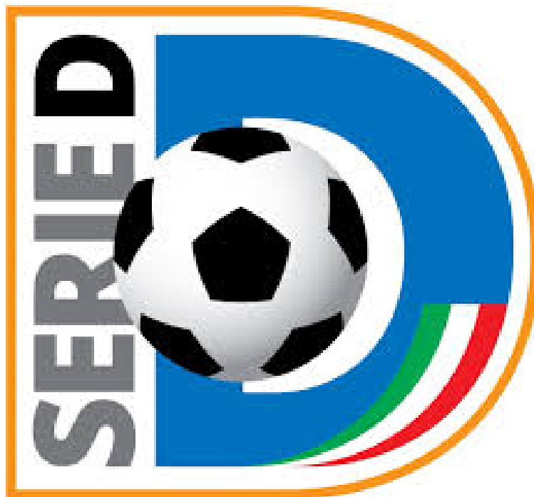
Logo Serie D