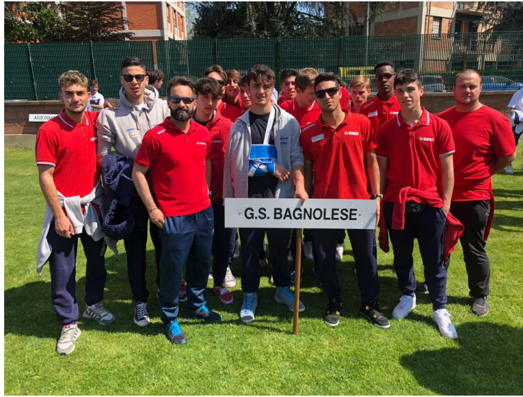
La Bagnolese presente ieri al Mirabello per il via del torneo Cavazzoli