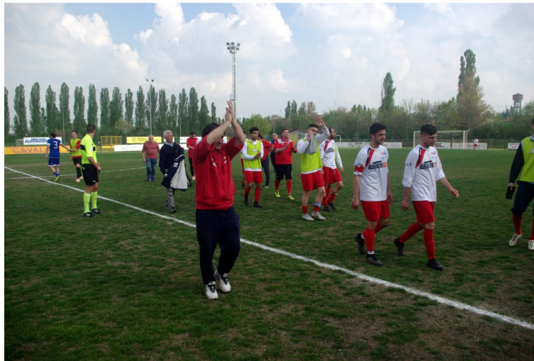
Una sola parola: grazie !