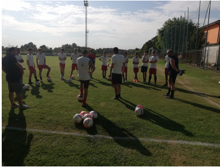
Il raduno della Juniores al Comunale di Cadelbosco Sotto