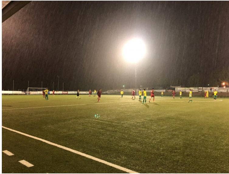
Un derby giocato sotto un incessante diluvio