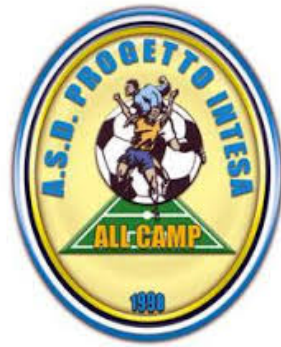
Logo Progetto Intesa

La partita di domani tra Montecchio e Bagnolese, valevole per la quinta giornata del girone di andata del campionato Juniores Regionali, si giocherà alle ore 15.30.(Luca Cavazzoni)