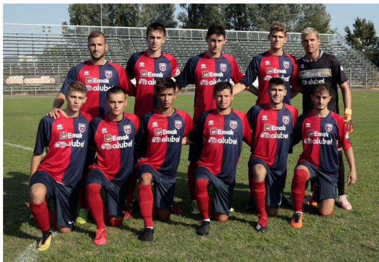
L'undici che ha iniziato l'amichevole del Morelli