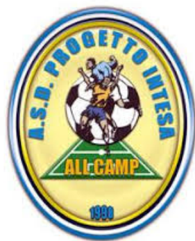
Logo Progetto Intesa