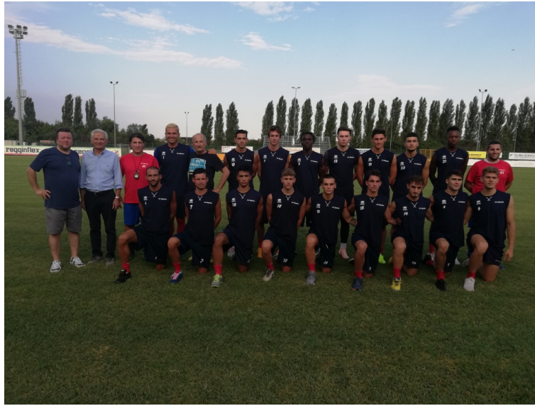
Il raduno di ieri della Bagnolese al Fratelli Campari