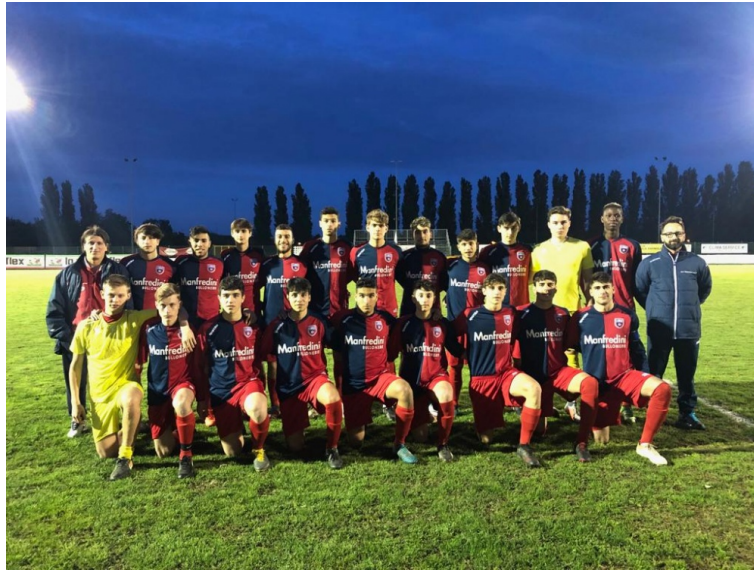
Il gruppo della Bagnolese che sta partecipando al torneo Cavazzoli nella categoria Under 20

In qualità di società organizzatrice del torneo Cavazzoli, la FalkGalileo ha sospeso le partite di questa sera valevoli per gli ottavi di finale. Le incessanti piogge ed i campi di conseguenza impraticabili hanno reso necessaria la decisione, tranne la gara tra Virtus Correggio e Paradigna che è stata spostata dall'ex Sporting in zona Cavazzoli sul sintetico Valli in città. Rinviate anche Bagnolese-Barcaccia che si sarebbe dovuta giocare alle ore 21 al Parco dello Sport di Cavriago, il cui recupero come per tutti gli altri match è fissato per giovedì sera alla stessa ora e nel medesimo impianto.